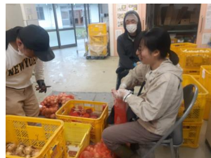
雨の日、玉ねぎをつめました

言葉がでなかったり、無表情でわかりにくい人が、自分となんにも変わらない素直な気持ちや、とっても魅力的な顔を持っているんだと気がつきました。自然栽培の畑では、いろんな生き物たちが飛んだり食べたりをさりげなく繰り返していました……つづきはWEBで！