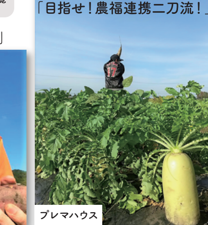
ハーブ農園ベザン ハーブ農園ベザン シンシア豊川 プレマハウス